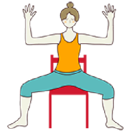
LA DIOSA KALI