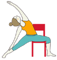
EL GUERRERO VARIACIÓN I