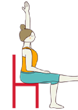
LA MESA EN EQUILIBRIO