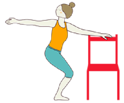
DIOSA CON TORSIÓN