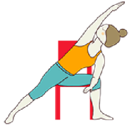
EL GUERRERO VARIACIÓN II