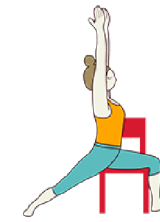
EL GUERRERO I