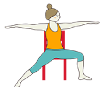
EL GUERRERO II