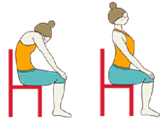
GATO / VACA