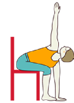
TRIÁNGULO EN EXTENSIÓN